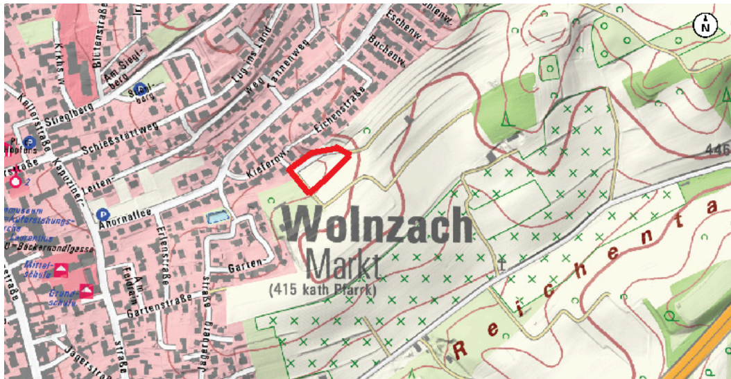
Topografische Karte

Talniederungen oder Kuppenlagen werden nicht betroffen.