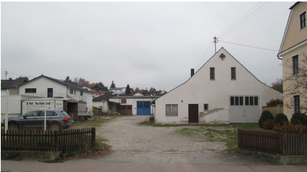
Abbildung 1: Blick ins Plangebiet von der Wendenstraße aus nach Westen, Aufnahme November 2019

Das planungsgegenständliche Grundstück Fl. Nr. 1219 ist in seinem westlichen Bereich mit mehreren Gebäuden bebaut (ehemalige Schreinerei) und wurde als Betriebshoffläche genutzt. Die Grundstücksfläche liegt brach.