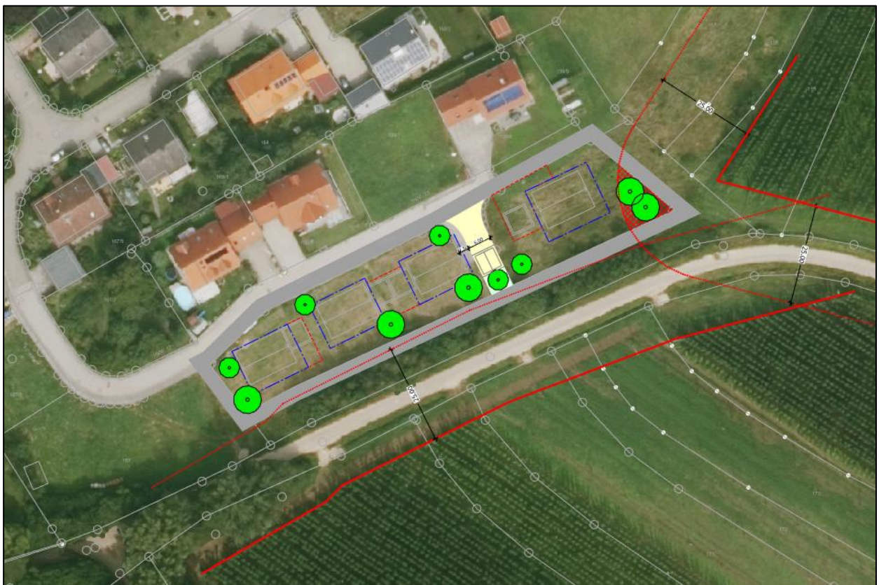
Abb.: Überlagerung der 1. Änderung mit DOP

Das Plangebiet grenzt im Süden und Osten unmittelbar an landwirtschaftlich genutzte Flächen an, die insbesondere dem Hopfenanbau dienen. Zum Zeitpunkt der Aufstellung des Ursprungsbebauungsplans wurden auf Grundlage der damaligen fachlichen Anforderungen größere Abstände zwischen Wohnbebauung und Hopfengärten zugrunde gelegt. In der Regel wurde hierbei ein Abstand von 50 m angesetzt. Da dieser im vorliegenden Bereich nicht eingehalten werden konnte, wurde der südliche Teil des Plangebiets im Ursprungsplan nicht als Bauland ausgewiesen. Zwischenzeitlich haben sich die fachlichen Rahmenbedingungen weiterentwickelt. Nach aktuellen Abstimmungen mit der Regierung von Oberbayern sowie den fachlichen Empfehlungen der Bayerischen Landesanstalt für Landwirtschaft sind zwischen Wohnnutzungen (einschließlich Gartenflächen) und Hopfengärten in der Regel Abstände von 25 m einzuhalten. Diese Abstände werden im vorliegenden Bebauungsplan im überwiegenden Teil des Plangebiets eingehalten. Lediglich in einem kleinräumigen Teilbereich im Osten wird der Abstand geringfügig unterschritten.