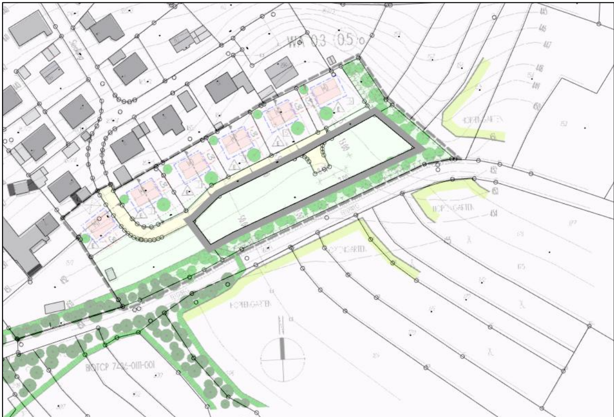
Abb.: Überlagerung Geltungsbereich der 1. Änderung mit rechtskräftigem Bauungsplan

Das Plangebiet liegt innerhalb des Geltungsbereichs des rechtskräftigen Bauungsplans Nr. 93 „An der Siedlung“ in Larsbach. Im Ursprungsbebauungsplan ist der betroffene Bereich bislang nicht als Bauland für eine Wohnbebauung ausgewiesen.