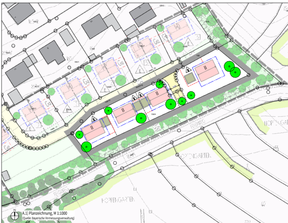
Abb.: Überlagerung 1. Änderung mit rechtskräftigem Bebauungsplan

Zur Verdeutlichung der planerischen Änderungen wird der Ursprungsbebauungsplan in überlagerter Form mit der 1. Änderung dargestellt. Hierdurch wird nachvollziehbar, welche Festsetzungen unverändert übernommen werden und in welchen Bereichen Anpassungen erfolgen.