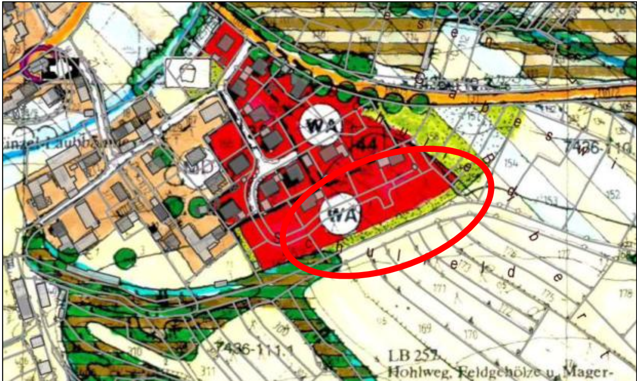
Abb.: Auszug rechtswirksamer Flächennutzungsplan; Bereich Larsbach

Das Plangebiet ist im rechtswirksamen Flächennutzungsplan des Marktes Wolnzach bereits als Wohnbaufläche (W) dargestellt.