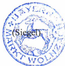
Machold 1. Bürgermeister