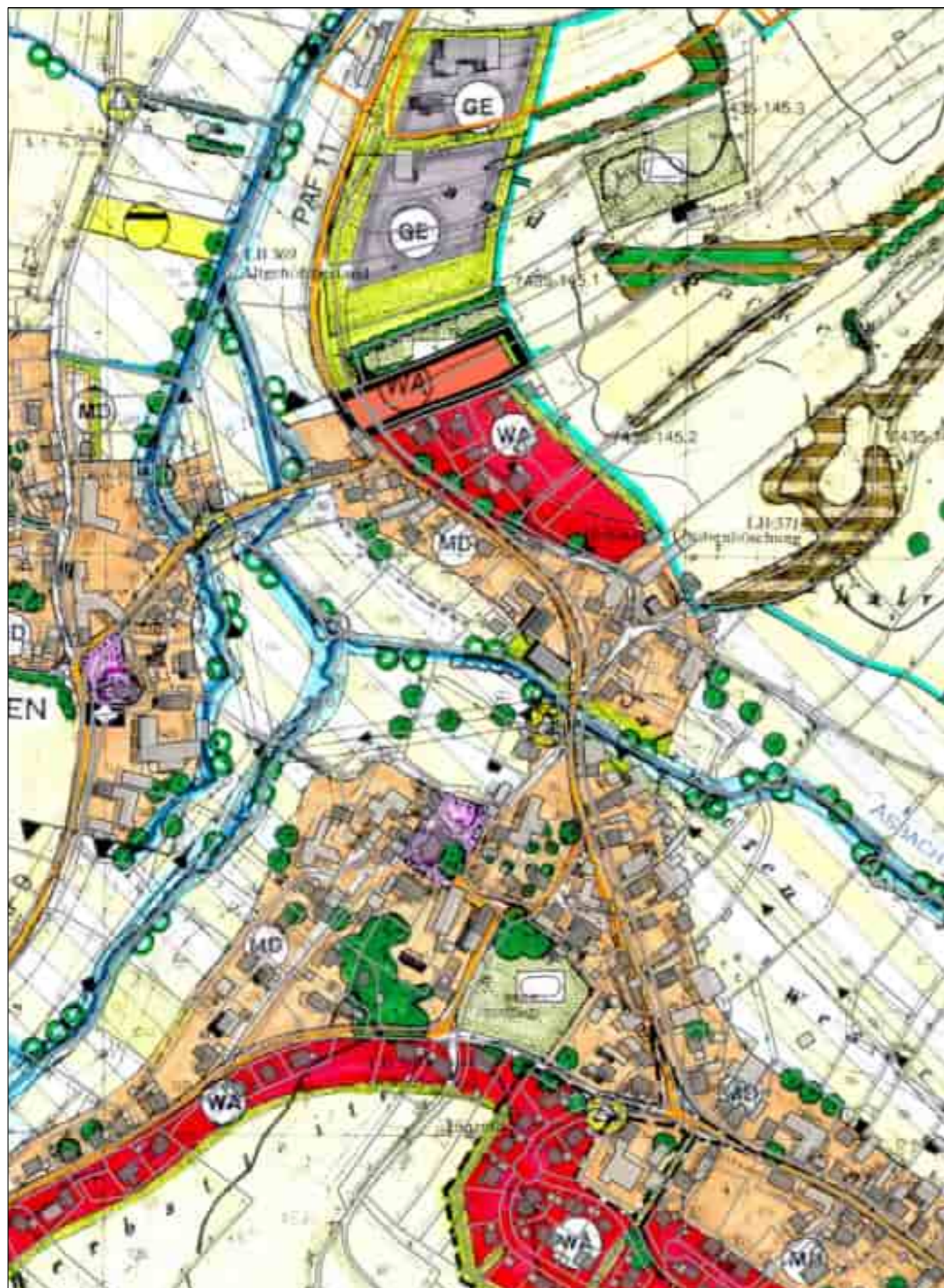
Auszug rechtswirksamer Flächennutzungsplan, M 1: 4.000