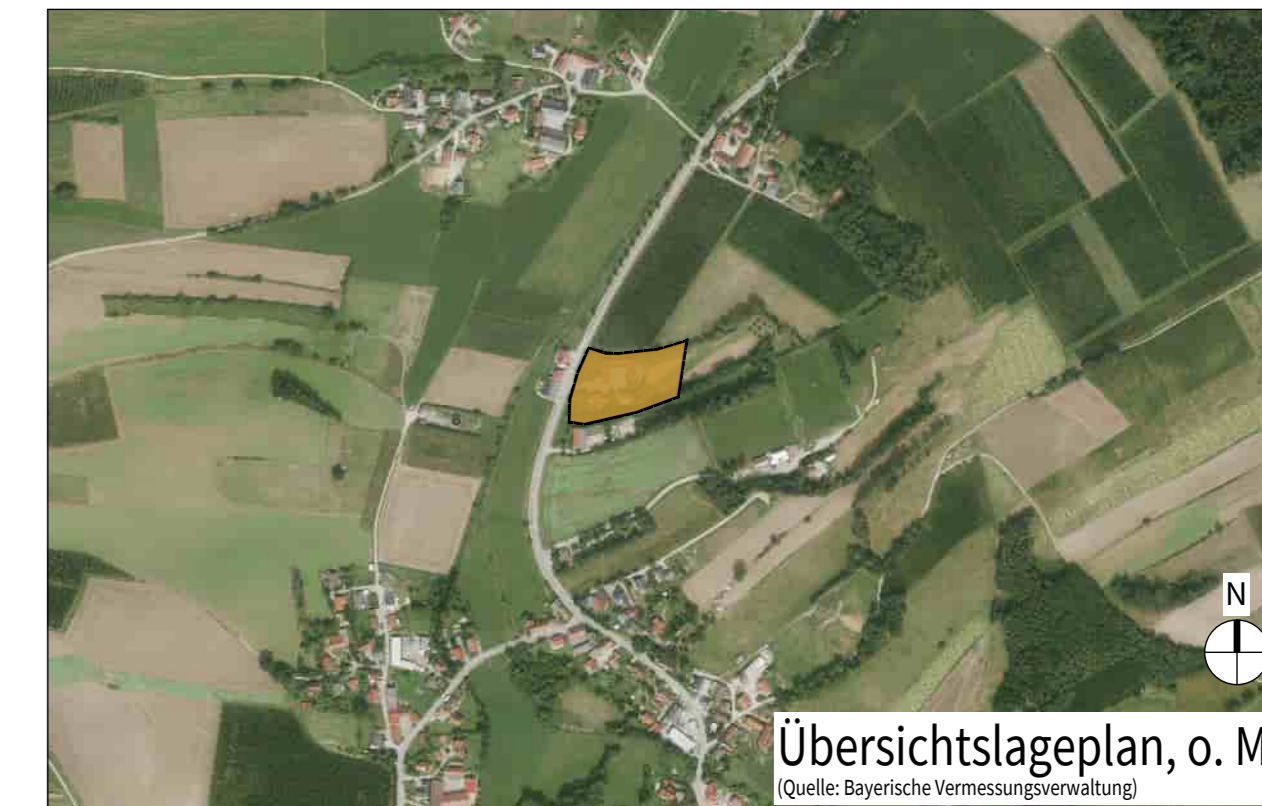
Übersichtslageplan, o. M.