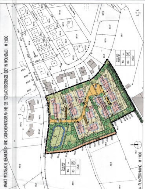
MARKT WOLNZACH BEBAUUNGS- UND GRÜNDUNGSPLAN NR. 28 'SCHLACHTERSTRASSE - SÜD' IN WOLNZACH M 1:1000